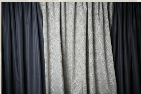
GRIS, DAMASK, GRIS 40' LARGE