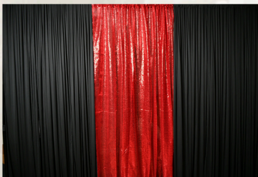
NOIR, ROUGE PAILLETTE, NOIR 20' LARGE